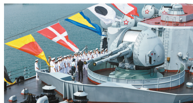
中俄“海上联合-2026”联合演习双方参演官兵互相参观舰艇。这是中方官兵参观俄罗斯海军“瓦良格”号导弹巡洋舰(无人机照片,7月8日摄)。