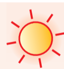
7月8日，在法国阿尔勒，人们在一处喷泉处消暑。今夏，法国遭遇连续高温天气。