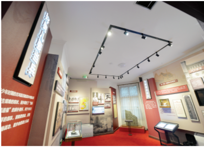
吉鸿昌旧居。