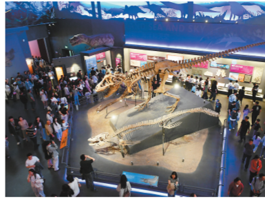
市民参观国家海洋博物馆。

保护单位。2024年11月24日,在吉鸿昌慷慨就义90周年纪念日之际,修缮后的吉鸿昌旧居再现光彩,成为人们近距离接触革命历史、感悟革命精神的红色教育阵地。