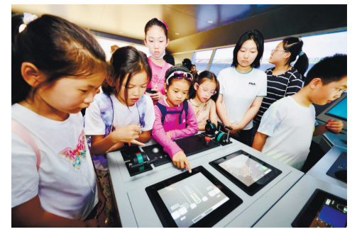
近期,和平区新津社区五爱教育阵地组织辖区青少年走进天津海运职业学院航海实训基地,开展“行走的思政课”研学实践活动。

三度携手是过往合作的见证,更是长远助力的起点。本次活动实现了岗位对接、能力提升与城市感知三重成效,是校地三年合作的又一次提质升级行动。下一步,校地双方将以三届专场招聘会为契机,持续深化政校企协同联动,搭建更多常态化供需对接平台,拓展优质就业资源,推动产教融合走深走实,引导更多优秀学子留在天津,为区域高质量发展注入源源不断的青年人才动力。 通讯员 毛春迎