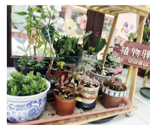
植物驿站内的花卉绿植。

如今,植物驿站已成为赏湖苑社区党建引领下十个特色便民品牌项目中的“重头戏”。除花卉绿植托管外,社区还配套打造了流动议事厅、周末邻里市集、非遗文化体验、老年日间照料等多项服务,回应居民日常生活的各类诉求。