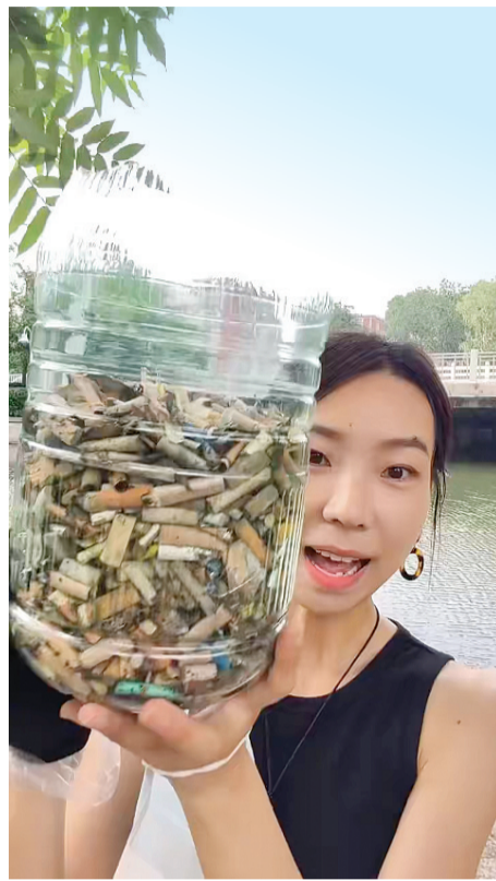
小张展示捡到的烟头。