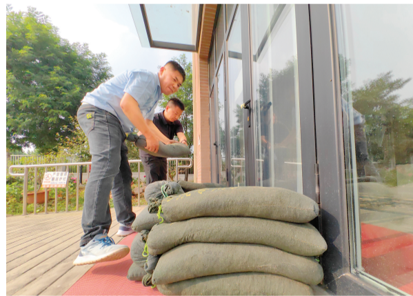
溪园康养中心的工作人员备好防汛沙袋。

宝坻区内有蓟运河、潮白新河等6条总长近195公里的一级行洪河道，窝头河、箭杆河等8条二级河道交织其间，加之87条干渠、508条支渠，这些河流水系担负着区域防洪、除涝等重任。宝坻区防办主任、应急局局长郭保民介绍，该区年平均降雨量为542.3毫米，去年降雨量为690.2毫米，预计今年较历史同期仍偏多。（下转第3版）