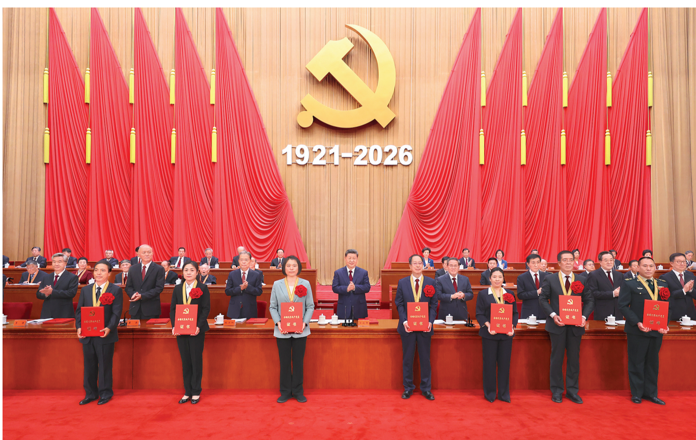
7月1日上午,庆祝中国共产党成立105周年大会在北京人民大会堂隆重举行。这是习近平等党和国家领导人为受表彰的全国“两优一先”代表颁奖。

健的步伐,行进到仪式现场。 在雄壮的《向祖国英雄致敬》乐曲声中,习近平为“七一勋章”获得者一一颁授勋章,并同他们亲切握手、表示祝贺。随后,“七一勋章”获得者受邀到主席台就座。全场响起一阵阵热烈的掌声。 蔡奇宣读《中共中央关于表彰全国优秀共产党员、全国优秀党务工作者和全国先进基层党组织的决定》。 习近平等为受表彰的全国“两优一先”代表颁奖。 在全场热烈的掌声中,习近平发表重要讲话。他表示,今天,我们隆重集会,庆祝中国共产党成立105周年,回顾我们党走过的光辉历程,展望党和人民事业发展的光明前景,动员全党全国各族人民满怀信心朝着全面建成社会主义现代化强国、实现中华民族伟大复兴的宏伟目标奋勇前进。习近平代表党中央,向全体中国共产党党员致以节日问候!向“七一勋章”获得者,向受表彰的全国优秀共产党员、优秀党务工作者、先进基层党组织表示热烈祝贺! 习近平指出,105年前,在中国人民和中华民族的伟大觉醒中,在马克思列宁主义同中国工人运动的紧密结合中,中国共产党应运而生。从此,中国人民和中华民族有了最可靠的主心骨,内忧外患、积贫积弱的中国开启了翻天覆地的历史巨变。 习近平强调,105年来,我们党团结带领全国各族人民不懈奋斗,创造了新民主主义革命、社会主义革命和建设、改革开放和社会主义现代化建设、新时代中国特色社会主义的伟大成就,书写了中华民族几千年历史上最恢宏的史诗。105年不懈奋斗,从根本上改变了中国人民的前途命运,开辟了实现中华民族伟大复兴的正确道路,展示了马克思主义的强大生命力,深刻影响了世界历史进程,锻造了强大的中国共产党。我们党完全无愧为伟大光荣正确的党。 (下转第4版)