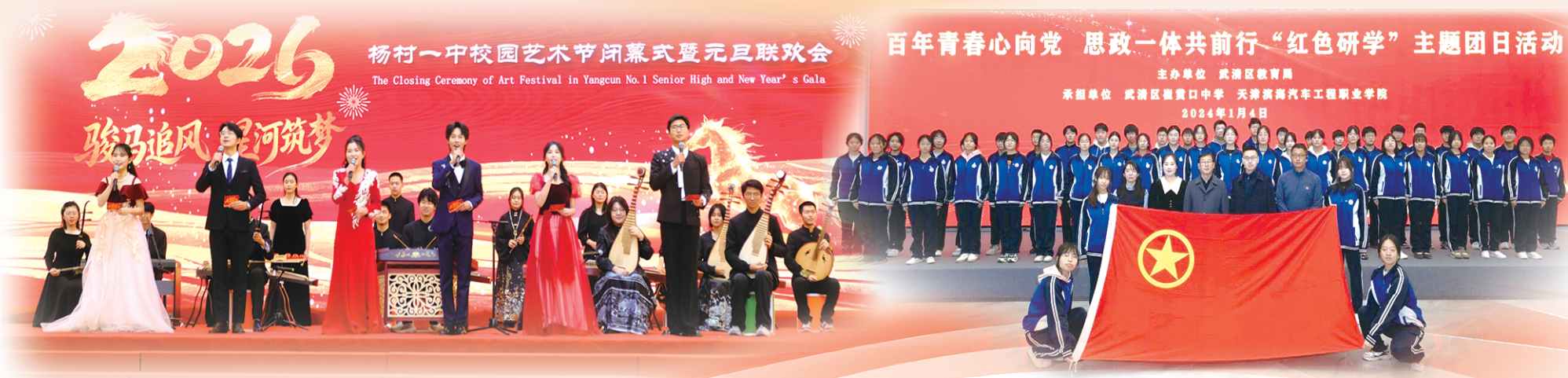
杨村一中校园艺术节闭幕式暨元旦联欢会 The Closing Ceremony of Art Festival in Yangcun No.1 Senior High and New Year's Gala

教育是强国建设、民族复兴之基，党的领导是办好教育的根本保证。“十四五”以来，武清区教育局持之以恒以习近平新时代中国特色社会主义思想为指导，深入贯彻落实习近平总书记视察天津重要讲话精神，全面加强党对教育工作的领导，全面提升基层党建工作质效，以高质量党建引领保障教育工作高质量发展。全系统紧扣全市高质量发展“十项行动”和武清区委“3+1+1”工作思路，真抓实干、久久为功，用心用情办好群众家门口的优质教育，推动教育教学质量实现整体跃升，持续为开创“京津明珠、幸福武清”建设新局面注入强劲教育动能，奋力书写新时代教育强国建设的武清答卷。