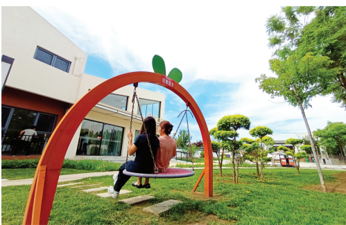
武清区河北屯镇李大庄村。

电子显示屏，仔细观察炉子底部一枚小小籽晶的缓缓转动。他和团队成员每天都要巡检好几遍，盯温度、看数据、查波动，虽然晶体一天只能长高5毫米，肉眼几乎看不出明显变化。