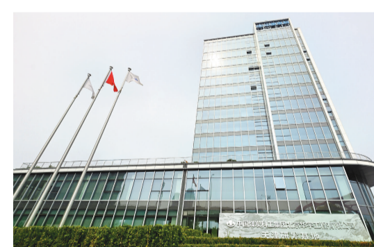
中国煤炭科工集团北京华宇工程有限公司天津研发基地。

如今4至5分钟就能完成,并且误差更小。“我们要做的,就是在智能化转型的路上,把核心技术牢牢掌握在中国人自己的手里。”杨记龙说。