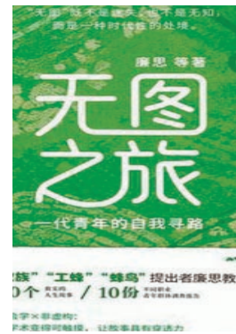
《无图之旅:一代青年的自我寻路》,廉思著,中国人民大学出版社2026年4月出版。