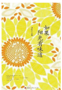
《如果阳光有味道》,蒋殊主编,山西人民出版社2025年1月出版。

商业模式是利益相关者的交易结构,本书的创新点清晰可见:围绕企业与用户两大核心利益相关者,从“品牌传递何种价值”“解决用户哪类核心问题”“产品和服务较竞品的独特优势”等维度切入,完成商业模式定位的深度革新。通读全书不难发现,本书对商业主体变化的把握精准深刻,理论体系严谨、观点凝练、案例贴合实践,堪称献给企业家、高