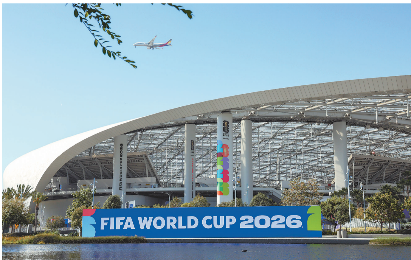
洛杉矶体育场静待美国赛区开幕式。