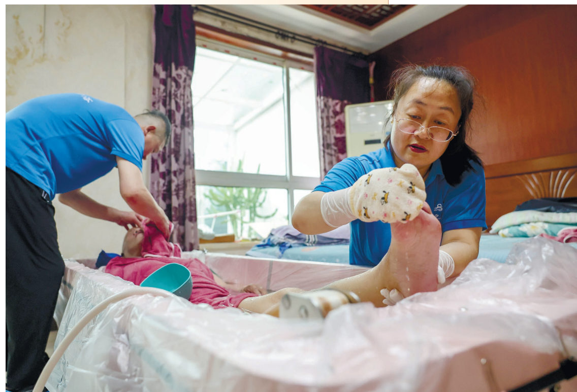
夫妻二人为老人提供细致的助浴服务。