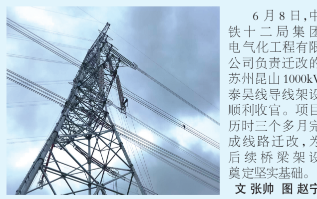
6月8日,中铁十二局集团电气化工程有限公司负责迁改的苏州昆山1000kV泰昆线导线架设顺利收官。项目历时三个多月完成线路迁改,为后续桥梁架设奠定坚实基础。 文 张帅

现场同步开展海事、港航综合执法检查,参会企业代表共同签署《天津港绿色靠泊自律倡议书》。