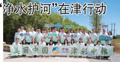
足生态建设大局,常态化开展环保公益与属地共建活动,坚持绿色生产、低碳运营,持续做强“津彩中粮”公益品牌,以央企担当助力美丽天津建设,为当地生态环境高质量发展贡献力量。 文 张伟