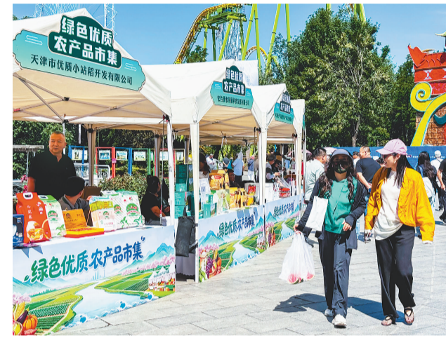
活动现场。

“我们将持续开展绿色优质农产品进展会、进景区、进商超、进电商平台等系列宣传推广活动,讲好天津绿色农业、生态农业、品牌农业故事,不断提升天津绿色优质农产品品牌知名度和市场竞争力,为乡村振兴注入强劲消费动能。”市农业发展服务中心科技与成果部部长郑桂亮表示。