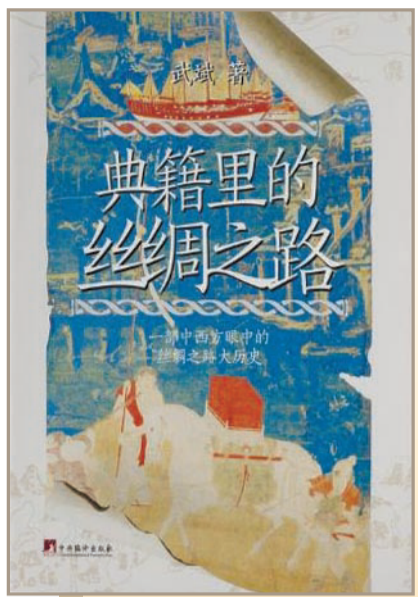
《典籍里的丝绸之路》,武斌著,中央编译出版社2025年1月出版。

全书共十三章,从“关于丝绸之路的早期传说”开始,依次展开汉代、魏晋南北朝、隋唐、宋元、明代及清代的典籍记载,其间穿插古希腊罗马文献、阿拉伯波斯文献、欧洲旅行家记述以及俄罗斯方面的记录,最终以“丝绸之路的定名与考察”结束。这样的编排既呈现了丝绸之路在文本中的“被发现”过程,也勾勒出这一概念从实践到命名、从区域认知到全球话语的知识谱系。学术著作如何走向大众,始终是一个值得探讨的议题。《典籍里的丝绸