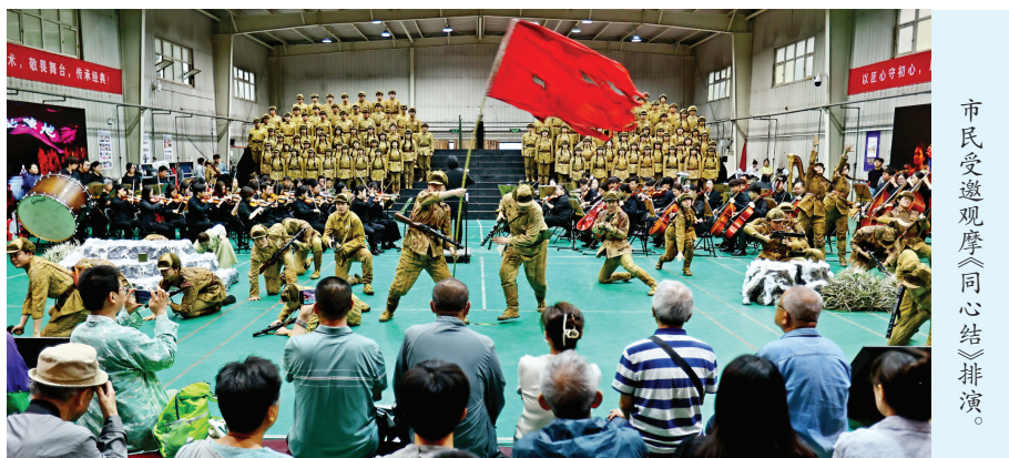
市民受邀观摩《同心结》排练。

2023年，天津音乐学院复排版《同心结》亮相第五届中国歌剧节，以精湛演绎赋予经典歌剧全新的生命力。此版歌剧在尊重原作的基础上，实现音乐与舞美的全面升级。音乐创作融合民族歌剧经典唱腔与当代交响化表达，旋律真挚动人、荡气回肠。剧中经典唱段《抬头仰望夜黑的天》以质朴深情的民歌风韵，细腻刻画