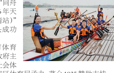
天津海河龙舟系列赛(武清站)成功举行。

开幕式上，伴随着铿锵鼓点，选手们奋力挥桨，展开团结与协作的比拼，两岸观众热情呐喊助威。这种同舟共济、追求极致的精神，恰与匠心品格深度契合——唯有经过无数次打磨与协作，方能成就非凡。赛事以龙舟为媒，将传统体育的刚健精神与匠心文化融为一体，让市民近距离感受龙舟竞渡的独特魅力，也为武清增添了浓厚的节日氛围，展现了天津开放包容、锐意进取的城市气质。