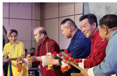
活动现场展示非遗精品。

该活动由天津市非物质文化遗产保护中心、津南区文化和旅游局、津南区融媒体中心及北闸口镇政府联合主办。活动采取“1个主会场+N个分会场”模式，在津南区葛沽镇、海棠街、咸水沽镇、辛庄镇、双港镇、北闸口镇及多所高校推出近60场民俗活动、体验课堂等。在研讨环节，来自京津冀三地的非遗工作相关负责人、项目传承人、专家学者共聚一堂，交流非遗保护心得，共谋合作发展新路径。“我们希望通过此次展览，探索融合发展新模式，让非遗真正成为滋养生活的文化养分。”津南区文化和旅游局相关负责人表示。