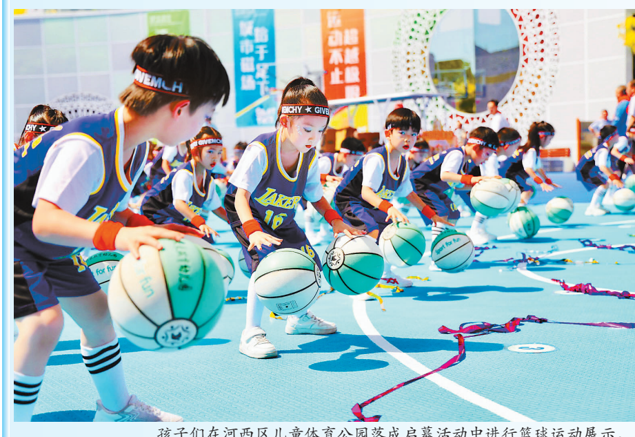
孩子们在河西区儿童体育公园落成启动仪式中进行篮球运动展示。

本报讯(记者 张帆 摄影 刘欣)昨日,由市关工委、华夏未来文化艺术基金会联合举办的“六一”特殊儿童奖学金颁发仪式暨河西区儿童体育公园落成启动仪式,在华夏未来体北总部举行。