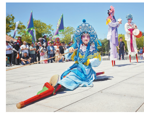
民间花会展示环节,东丽区的大杨驾前高跷与长祥高跷、津南区的海下文武高跷及青凤高跷队、北辰区的刘安庄同心高跷接连亮相。

民间花会展示环节,河东区的青莲高跷队、东丽区的大杨驾前高跷与长祥高跷、津南区的海下文武高跷及青凤高跷队、北辰区的刘安庄同心高跷接连亮相。此外,滨海新区的汉沽飞镖队、大沽龙灯也带来了精彩展示。非遗市集上人头攒动,津派周氏风筝制作技艺、津沽泥彩塑、大郑剪纸等非遗项目展台令人驻足。此外,东丽区的志愿者还在现场为游人发放了《天津非遗地图》,讲解各项非遗技艺的渊源。