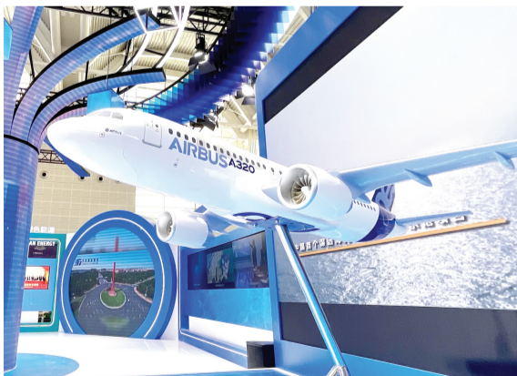
第四届天津国际航运产业博览会各大展区布展已基本完成。

以展会为纽带,玉湖冷链(天津)交易中心、中远海运修造船、中资环集团塑料再生等一批重大项目落地;国能集团航运板块在津持续扩大运营,招商局集团“港荣号”滚装船在津首航,东疆第1000艘船舶租赁签约……随着央企、民企纷至沓来,我市航运产业生态持续优化,产业链条不断延伸,铁矿石、煤炭等大宗商品储运