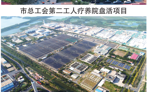
津沽污水处理厂分布式光伏项目

新的繁花向更远处绽放。城投集团统筹推进6个城市更新项目,完成54个老旧小区改造、12项市级民心工程。中国医学科学院天津基地项目打造京津冀新质生产力创新协同区,天津西站南片区城市更新项目加快推进以站聚产、以产兴城……产城人融合正在蓝图走向日常,绘就“三生融合”的新画卷。