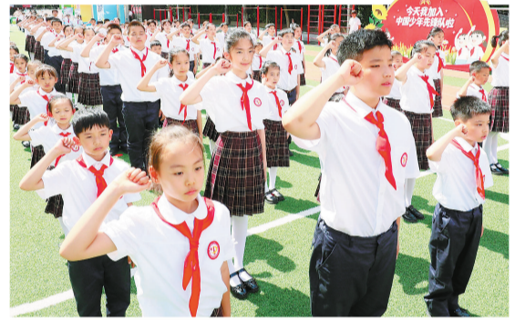
活动现场,新少先队员们在庄严宣誓。

据悉,团市委、市少工委将在全市各级少先队组织中广泛开展“高举队旗跟党走 做新时代好少年”少先队主题活动,引导广大少先队员传承红色基因、传承中华文脉、传承奋斗精神,争当爱党爱国、勤奋好学、全面发展的新时代好少年。