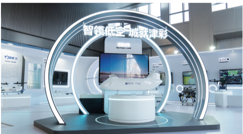
智汇中心大厦低空经济展厅

托高校资源及首都都市圈建设机遇,以“三区联动”破题——创意产业社区、大学创新校区、活力复兴街区彼此赋能,“初创孵化—产业集聚”的链条日渐成形,产教融合的生态渐入佳境,兼具经济带与景观带属性的产业集聚区、文化集聚区格局已成。产业的种子破土发芽,城市更