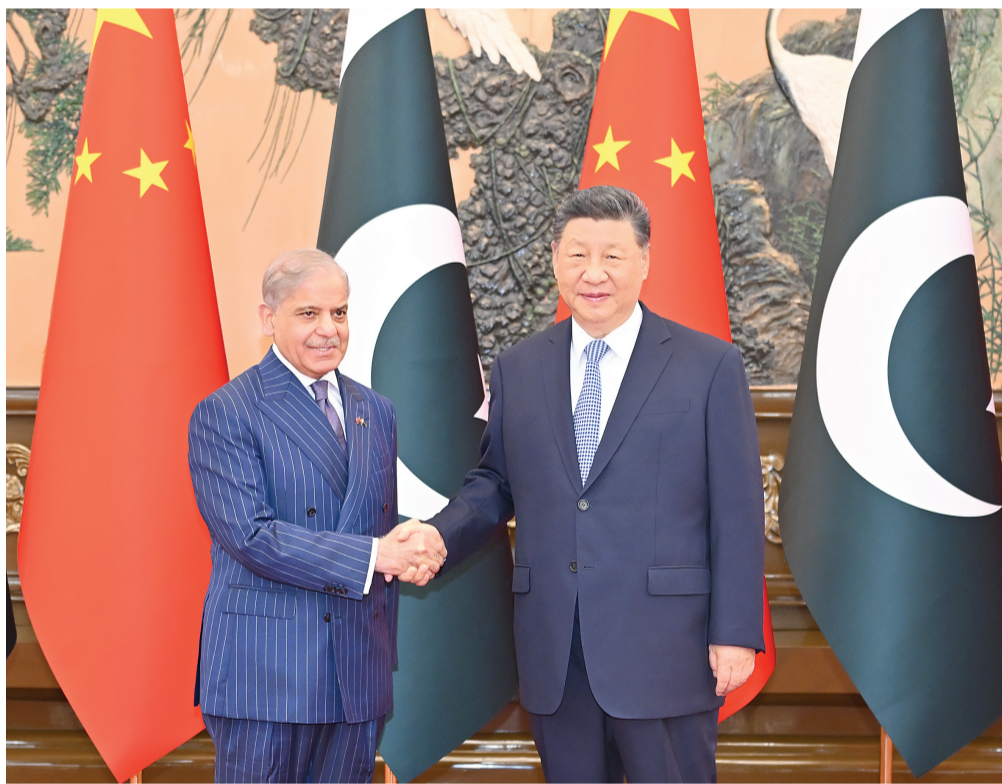
5月25日下午，国家主席习近平在北京人民大会堂会见来华进行正式访问的巴基斯坦总理夏巴兹。

新华社北京5月25日电(记者 杨依军)5月25日下午，国家主席习近平在北京人民大会堂会见来华进行正式访问的巴基斯坦总理夏巴兹。