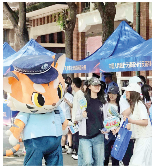
游戏互动区,学子们积极参与。

据悉,5月15日,天津公安机关还将联合相关部门在全市人员密集区域集中开展宣传活动,并通过新媒体矩阵推出系列特别节目,防范短视频及互动答题H5小程序,持续扩大宣传覆盖面,切实守护好人民群众的“钱袋子”。