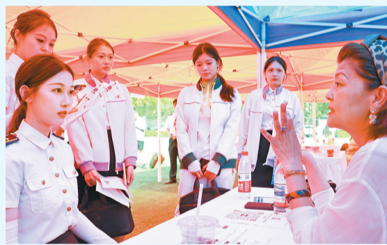
中国民航大学志愿服务对接会现场。