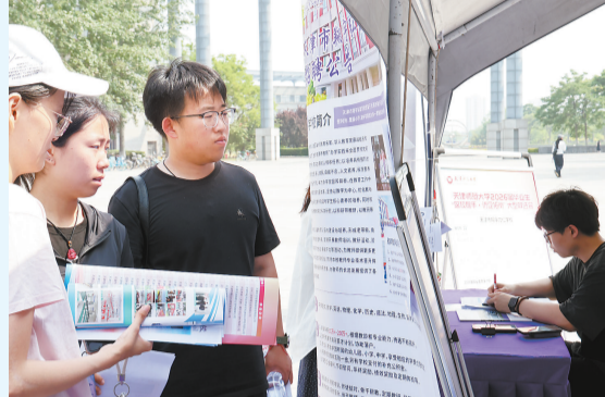
天津师范大学双选会现场。