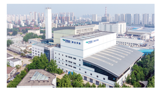
泰达环保。

泰达环保是上市公司泰达股份的一支劲旅。对泰达股份而言,去年7月的更名——将“资源循环”写入企业名称,极具标志性:公司毅然剥离非核心资产,聚焦固废循环、材料循环、绿色服务三大主业,把资源集中到最具优势的赛道上来。(下转第6版)