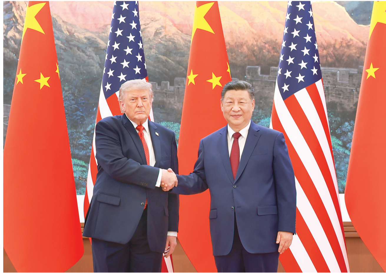
5月14日上午,国家主席习近平在北京人民大会堂同来华进行国事访问的美国总统特朗普举行会谈。