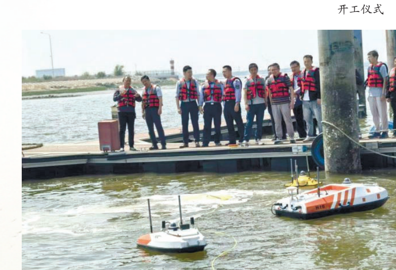
无人艇、水下机器人培训