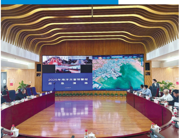
2025年海洋灾害预警报应急演练