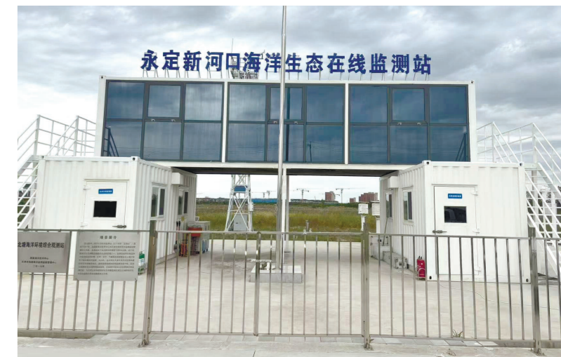
永定新河口海洋生态在线监测站