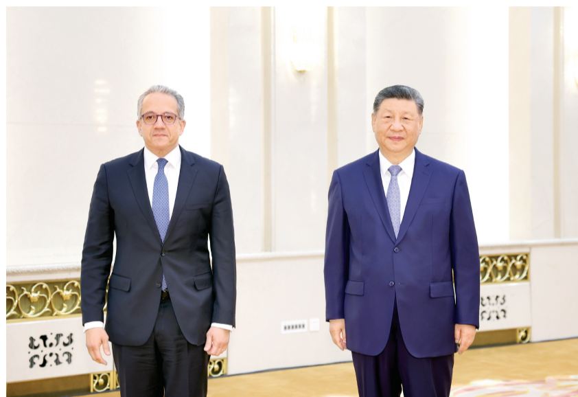
5月12日下午，国家主席习近平在北京人民大会堂会见联合国教科文组织总干事阿纳尼。