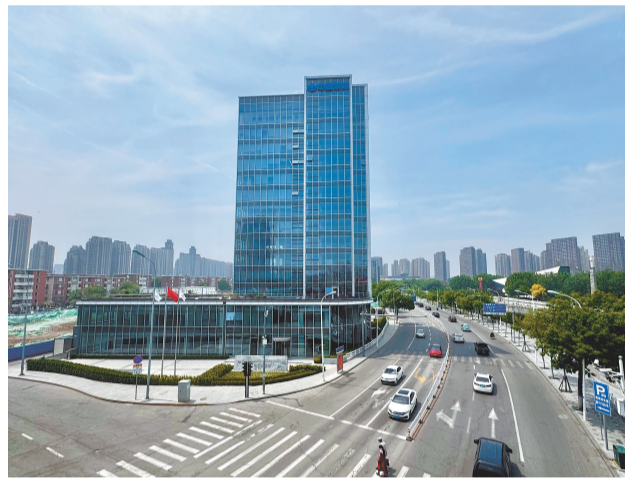
中国煤炭科工集团北京华宇工程有限公司天津研发基地。