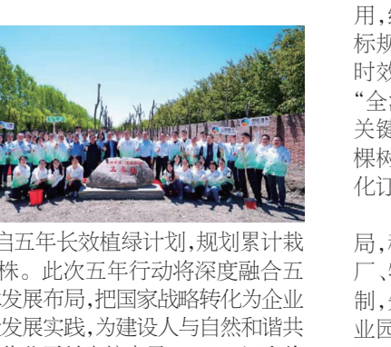
木,开启五年长效植绿计划,规划累计栽植300株。此次五年行动将深度融合三维一体发展布局,把国家战略转化为企业高质量发展实践,为建设人与自然和谐共生的现代化贡献中粮力量。文 张伟

“Very good! Tianjin is warm!”乘坐878路的一名美国留学生接过了手册,竖起了大拇指。