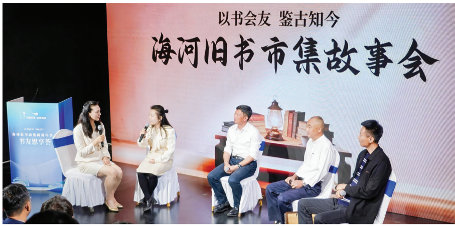
4月30日,海河旧书市集两周年活动在棉3创意街区开启。图为爱书人分享与海河旧书市集的故事。

砖红色的百年厂房镌刻着工业遗产的沧桑,泛黄的书页承载着城市文脉的厚重。为贯彻落实《全民阅读促进条例》,推进书香天津建设,传承发展津派文化,4月30日,海河旧书市集两周年活动在棉3创意街区开启,专家学者、书店主理人、市集服务者、读者等欢聚一堂,共同回顾了海河旧书市集从一缕“文化微光”变成辐射京津冀“文化名片”的历程,共商旧书市场发展,共话津沽文脉传承。作为2026年书香天津·全民阅读重点活动之一,海河旧书市集提升行动现场启动。