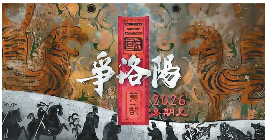
《三国第一部:争洛阳》海报