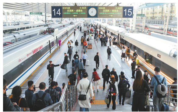
国铁北京局2026年“五一”假日运输即将启动。

客流方面,“五一”假期,天津站预计发送旅客84万人,日均发送10.5万人,同比增幅7.3%,旅客发送高峰预计出现在5月4日,当日旅客发送量预计达12万人;天津西站预计发送旅客57.8万人,日均发送7.2万人,同比增幅8.9%,旅客发送高峰预计出现在5月5日,当日旅客发送量预计达8.2万人;天津南站预计发送旅客16.1万人,同比增幅达30.9%,旅客发送高峰预计出现在5月6日,当日旅客发送量预计达2.7万人。