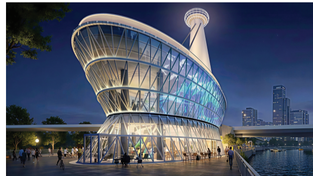
赤峰桥津旅左岸空间效果图。