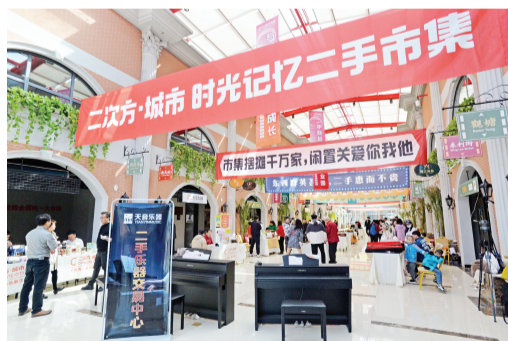
二次方举办二手市集。