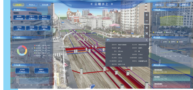
“云瞰水上”的地下管网三维空间透视。

招商推介、应急响应等日常治理场景，让技术服务于基层、惠及群众，让智慧赋能落地见效。