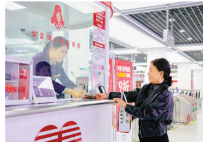
地铁1号线双桥河站工作人员为周边村民提供便民服务。