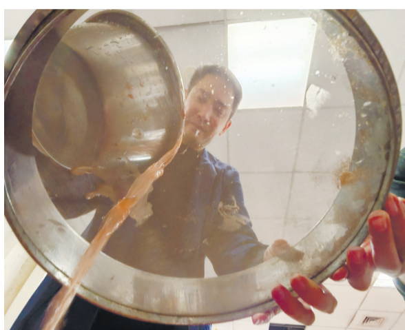
工作人员为纸张做旧调制“秘料”。