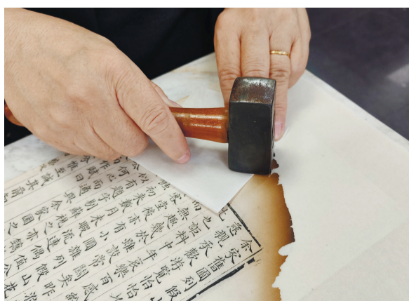
捶书,古籍修复后慢慢捶到原来的厚度。

在天津图书馆古籍文献部的修复室里,泛黄纸叶间,修复师指尖轻捻、补缀无痕,让一册册濒危古籍重获新生。作为国家级古籍修复中心、拥有可移动文物修复资质的专业机构,这里以匠心守护文脉,用坚守传承技艺,成为天津古籍保护的重要力量。