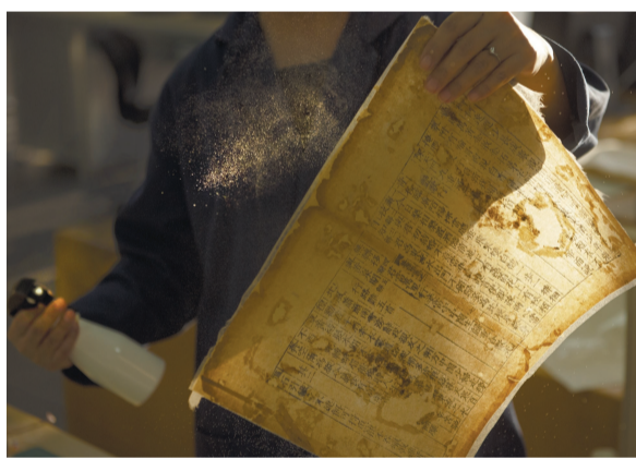
为修补后的书页均匀适量喷水,再放入吸水纸中压平。