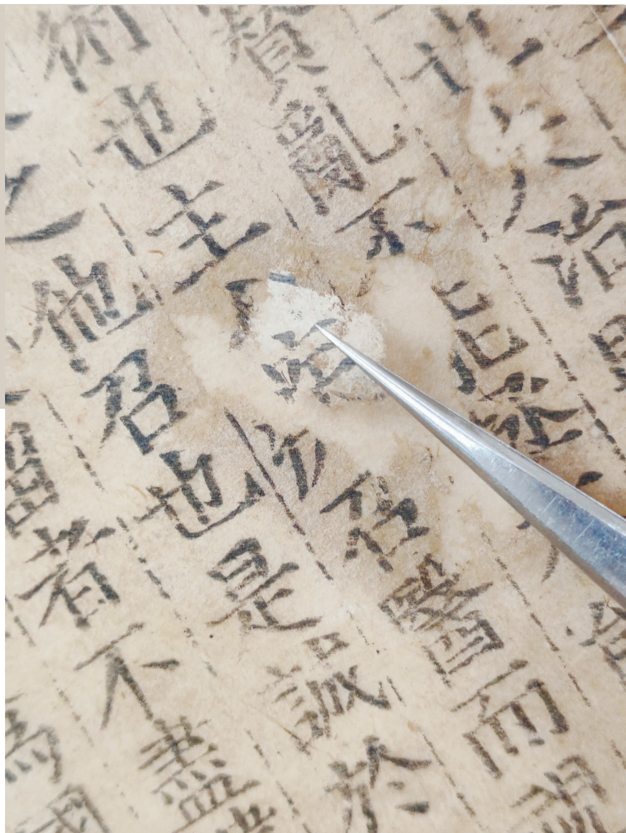
技术人员通过查找原文,把散落的半个字修复好。