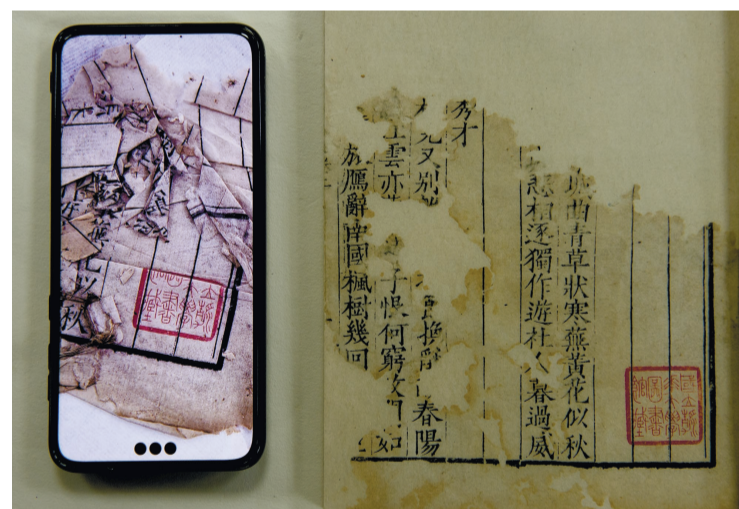
残叶修复前后对比。