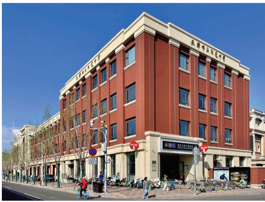
我市首个“教育+轨交”项目——汉阳道中学地铁上盖项目顺利通过竣工验收,即将投用。建成后新增18间标准化教室,提供近810个优质学位。

作为全国首个海事流动仲裁庭,“津海法通”聚焦船员民生争议,将服务触角延伸至船员患病、工伤待遇等领域,践行新时代“枫桥经验”。