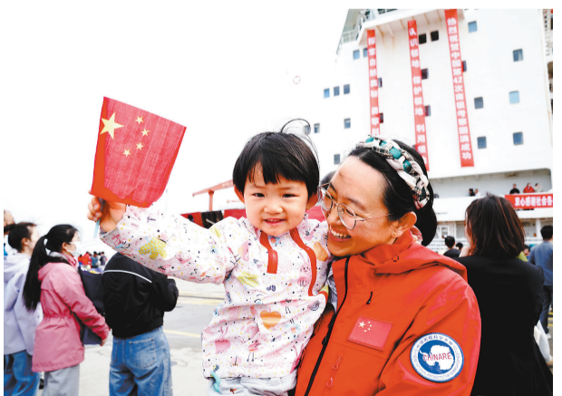
南极考察队队员(右)与家人团聚。