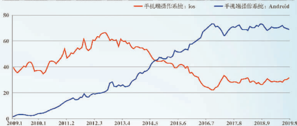
2009 年—2019 年手机端 Android 与 iOS 操作系统市场份额(单位：%)

这意味着，鸿蒙作为全新的操作系统，不仅需要在全世界市场份额几乎被 Android 和 iOS 统治的情况下，闯出自己的市场空间，还需要保证其生态系统足够完善，体验足够舒适，否则用户还是会转向 Android 或 iOS 系统。