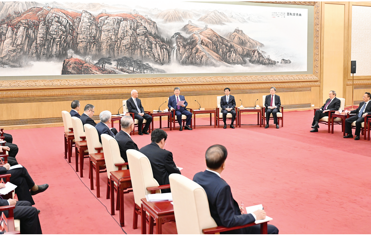
2月11日,习近平、王沪宁、蔡奇、丁薛祥等在北京人民大会堂同党外人士欢聚一堂,共迎佳节。