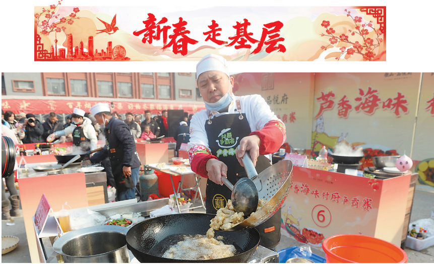
▲ 村厨争霸赛现场。 ▲ 大集上的高跷表演。