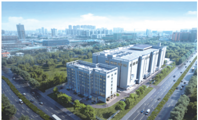
广东中山德华芯片公司空间能源系统自动化产线建设项目效果图

此次中标的四项工程涵盖集成电路、新型显示、智慧医药、数字经济等前沿领域。其中,广东中山德华芯片公司空间能源系统自动化产线建设项目将建设为外延、芯片、组件、电源系统的全产业链生产车间及建设空间太阳能电池可靠性实验中心;广东三龙湾芯智汇园聚焦芯显相关新兴产业,构建一体化生态,打造大湾区芯显产业集群;华润医药供应链项目定位为智慧化、绿色化、多功能的现