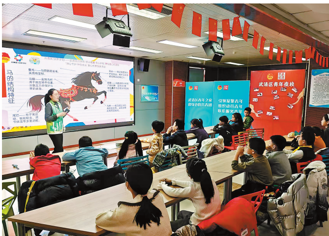
图为社工和志愿者为孩子们辅导作业、组织开展各种活动。

小年纳福,岁安人和。衷心感谢广大市民朋友及社会各界的理解与支持,恳请大家继续自觉遵守我市烟花爆竹禁燃禁放相关规定,让“津城蓝”成为春节最美底色。