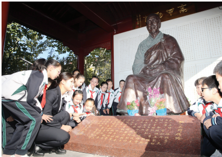
李叔同故居纪念馆

中小博物馆破圈之路,从不止一种解法。有的以协同联动为抓手,打破单一场馆的局限,从点到面拓展文化内涵;有的则以沉浸体验为核心,盘活历史建筑资源,让文化遗产在互动中焕发新生。