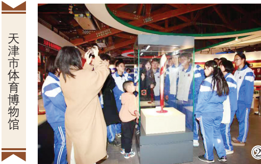
天津市体育博物馆

走进天津市体育博物馆,除了常设展“天津与奥运”,馆内还有多个专题展同时展出。该馆工作人员介绍:“虽然中小馆在体量上不占优势,但我们主动求新求变,及时更新展览,打破空间局限。比如随着赛事节点在馆内推出女排精神展、第43届世乒赛成功举办30周年特展、全运会文化藏品展等,还把展览送到社区、学校、企业等,并进行线上展示,把体育故事和蕴含精神送到观众身边。”