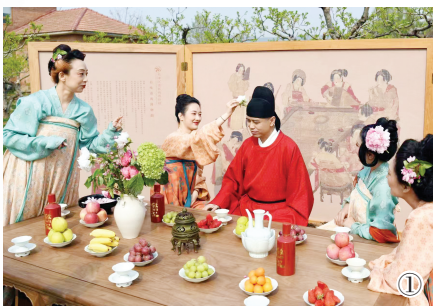
天津沉香艺术博物馆

中华文化的博大精深,往往体现在以小见大之中。天津沉香艺术博物馆就在努力挖掘“沉香”这一看似小众的主题。2010年该馆成立之初,以如何区分沉香产地、优劣等内容进行科普,而后推出多个沉香主题展览,特别是联合山东博物馆举办的“空灵之约——中国沉香文化展”,通过数百件(套)展品梳理香文化发展脉络,获评全国博物馆十大陈列展览精品推介优胜奖。