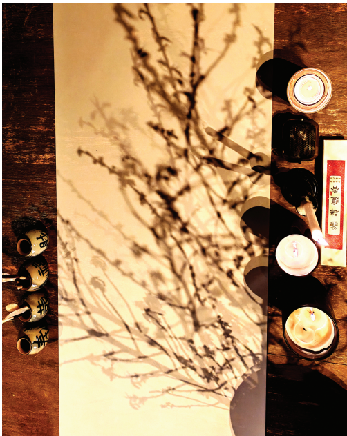
看似随意的摆放,几个花枝的身影便跃然纸上,竟成为一幅写意画。

在天津港保税区空港实验小学,有一堂特殊而专业的美育课——“非遗传统插花技艺”。课程不仅讲授插花的审美、方法与技巧,更深入融汇插花历史、礼仪等文化内涵。孩子们学习到,插花最早以原始花束、胸花、头花等形式出现于春秋战国时期,用于馈赠、祭祀等场合,《楚辞·九歌·山鬼》《诗经·郑风·溱洧》等古籍中均有相关记载。插花艺术在汉代步入初始阶段,隋唐时期日趋兴盛并传入日本,至宋代达到鼎盛——这些历史脉络,学生们都能娓娓道来。