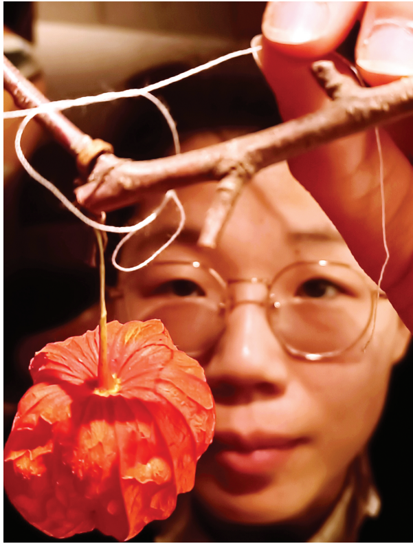
团队成员正在使用花材和丝线展示古代插花方式。