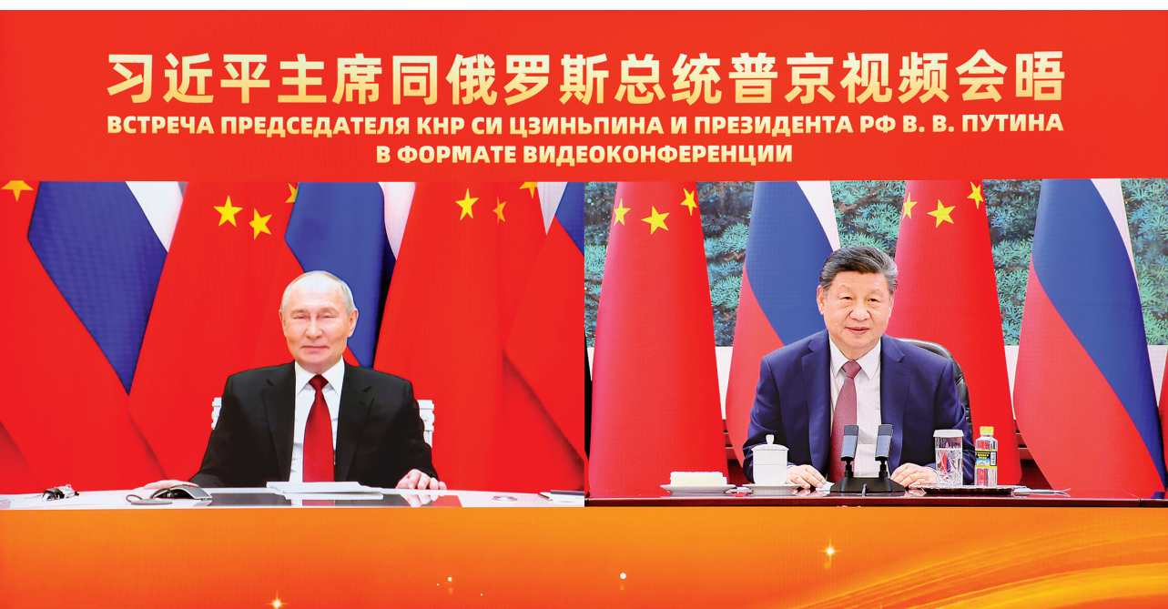
下图 2月4日下午,国家主席习近平在北京人民大会堂同俄罗斯总统普京举行视频会晤。