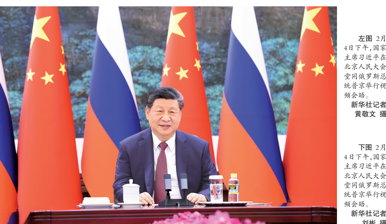
左图 2月4日下午,国家主席习近平在北京人民大会堂同俄罗斯总统普京举行视频会晤。