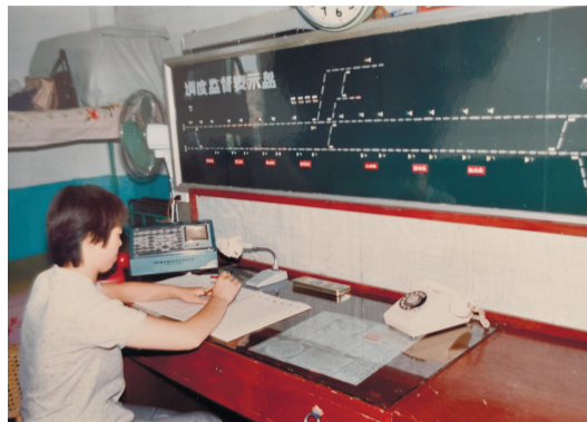
1980 “7047工程”时期二纬路指挥中心行车调度室。