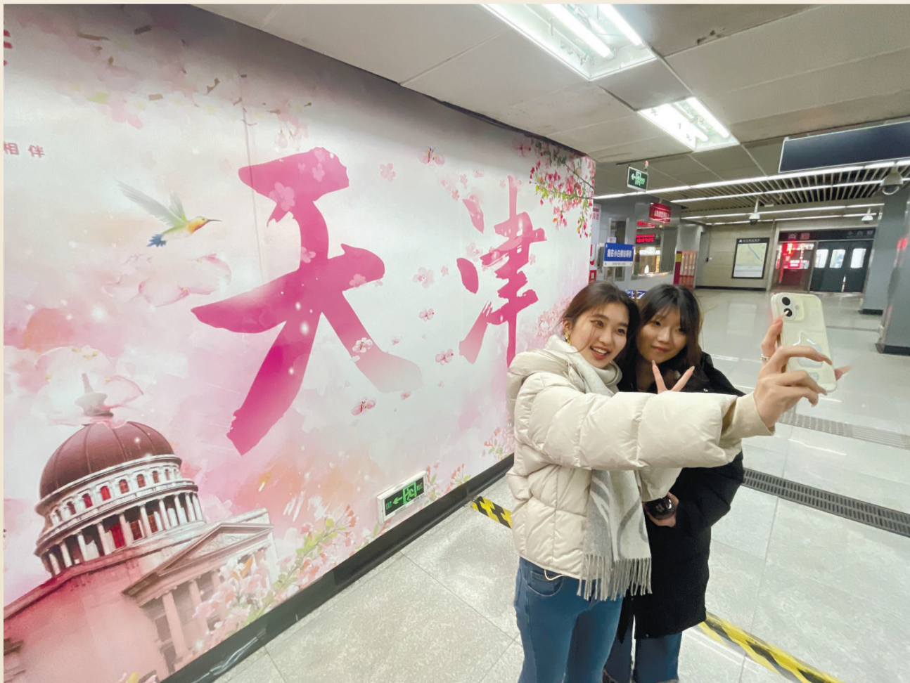
游客在地铁站内打卡拍照。