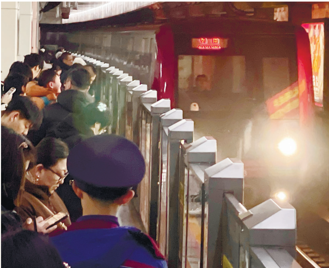
天津地铁1号线已成为市民出行重要的交通线路。