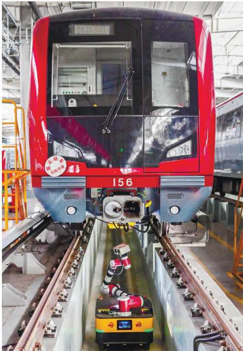
地铁检修机器人搭载高精度机械臂、高清摄像头与自主导航模块,可自主规划路径,实现厘米级精准定位。