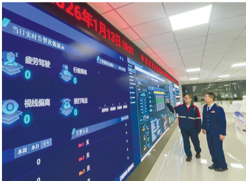
在天津1号线段场调度指挥中心,司乘疲劳系统始终在运行着,它能够对司机疲劳驾驶、离岗等七类异常行为进行毫秒级识别、提醒。