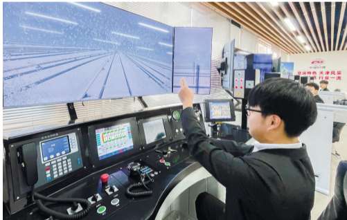
司机们在使用驾驶模拟器进行列车驾驶操作训练,模拟器可设置57种列车故障以及火灾、水患等48种应急场景,对于提升司机应对异常情况的能力至关重要。