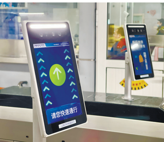
如今 人脸识别过闸功能方便了乘客出行。