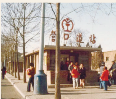
▼“7047工程”时期的营口道地铁站。