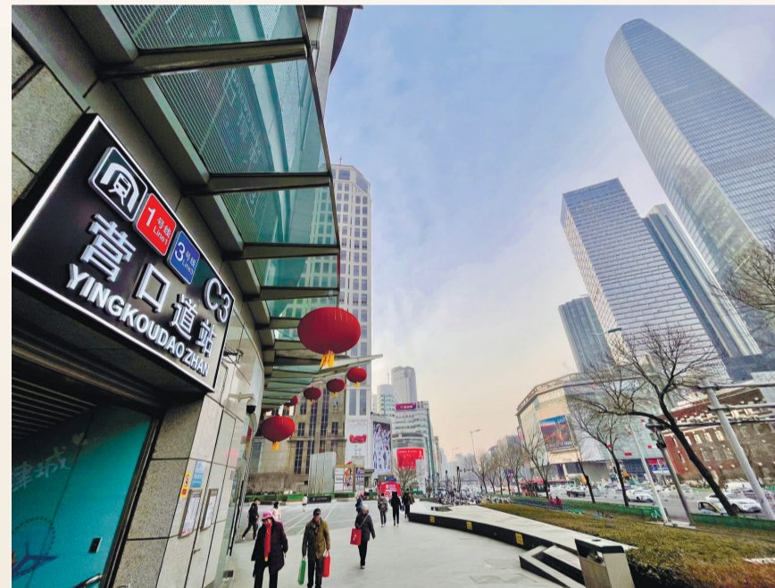
◀如今的营口道站周边高楼林立。