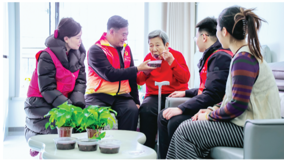
在西青区精武镇潘楼村,“粥到暖人心,乐享腊八节”主题活动浓情上演。