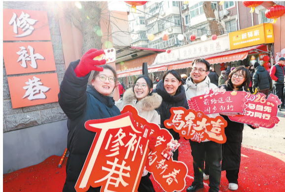
市民在修补巷前打卡拍照。

“王串场街将以传统节日为纽带,不断丰富活动内容、优化服务体验,既传承匠心文化,又激活商业活力,让居民在浓厚年味中尽享实惠,为辖区发展注入蓬勃动能。”王串场街相关负责人说。