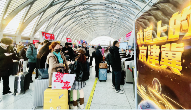
京津冀环线高铁抵达天津西站,旅客准备进站上车。

昨天8:54,随着G8864次列车缓缓驶出,天津西站开行的首列京津冀环线高铁顺利发车。首次开行的“北京西—保定东—天津西”“北京西—大兴机场—天津西”京津冀环线高铁共有2对,在早晚高峰精准发车。早高峰G8859/60次列车,6:48从北京西站始发,经保定东站、白洋淀站,8:38终到天津西站,接续G8864次列车可快速从天津西站返回北京西站。晚高峰G8863次列车,15:47从北京西站发车,经大兴机场站,17:01抵达天津西站,接续列车也将实现高效返程,环线高铁天津西站至白洋淀站最快可43分钟到达。