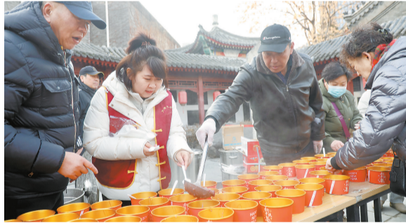
在拥有700年历史的天后宫内,“七百文脉·腊八启年”腊八节民俗体验活动火热上演。