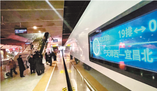
开往宜昌的G1739次列车从天津西站准备发车。

在开行京津冀环线高铁的同时,昨天7:45,天津首列开往宜昌的高铁列车G1739次也正式开行。该列车全程运行1271公里,设18个停靠站,途经德州东站、平顶山西站等关键交通枢纽,将为京津冀与华中地区的互联互通搭建起高效便捷新桥梁。