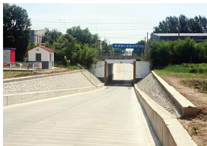
▲静海区 杨家园地道维 修改造完成。

交通治理更加精细智慧。 新增优化公交线路45条,开通通学公交35条,更新新能源公交车400部,新建北辰道2.1公里公交专用道,提升改造12公里公交专用车道。完善中心城区40条道路交通安全设施,优化103处主要路口交通组织。建成22处停车场,增加停车位5120个,提升43处路灯设施。在奥体中心体育场等9个重点区域周边设置临时停车区域,保障大型活动期间交通有序。持续完善交通提示信息发布,累计发布拥堵、管制等信息2.03万条,提供出行信息服务1.8亿次,让智慧交通惠及每一位市民。