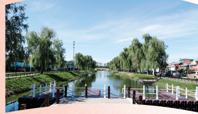
▲宝坻区小辛码头村水系治理完 成后,村容村貌得到改善。