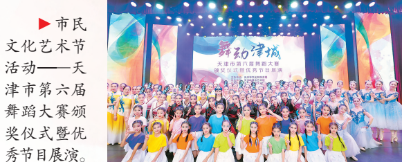
▲市民 文化艺术节 活动——天 津市第六届 舞蹈大赛颁 奖仪式暨优 秀节目展演。