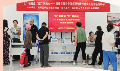
▲南开区长虹街道就业驿站举办 专场招聘会。