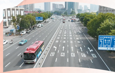
▲国堤道和大沽南路交口数字化 编号导行,群众出行指引更加明确。