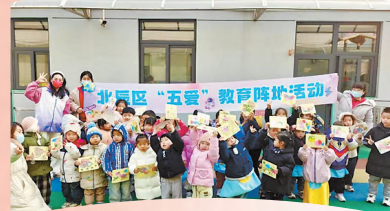
▲北辰区普东街今日家社区 “五爱”教育阵地“智慧广电赋能成长 趣味手工点亮科普时光”活动。