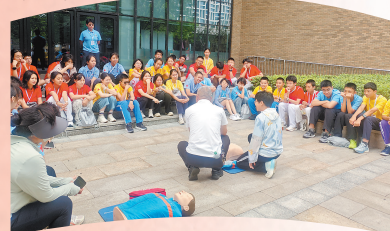
▲在天津工业大学开展“关爱生 命·救在身边”急救知识与技能培训。