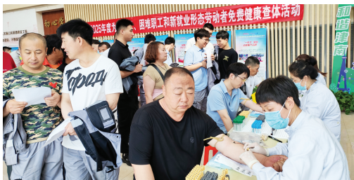
▲开展职工免费体检。

扶弱助困的力度持续加大。 全年开展救助服务项目78个,服务救助对象29635人次,让困难群众感受到社会的温暖。惠工暖心服务精准覆盖,对在职工会会员开展大病救助460人次,发放救助金1697万元;住院关爱慰问44055人次,发放慰问金3488.9万元;为40250名农民工、困难职工和灵活就业形态劳动者提供免费健康体检,用实实在在的实际行动维护劳动者权益。