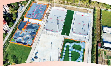
▲宁河区轮滑主题公园完工。