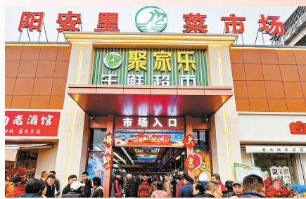
▲河东 区阳安里菜 市场开业。

每一个数字,都对应着一个家庭的安心、一次出行的顺畅、一份笑容的绽放;每一项工程,都凝聚着为民服务的初心、破解难题的决心和久久为功的恒心。从民生底线到城市运行,从物质基础到精神滋养,天津市2025年20项民心工程如同一幅精心绘制的工笔画,细致入微地描绘出“人民城市为人民”的温暖图景。这份用实干书写的温情答卷,不仅写在了城市发展的年轮里,更深深印在了每一位市民的心坎上,汇聚成推动天津高质量发展的磅礴力量。