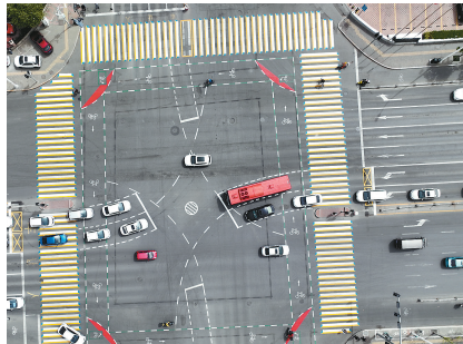
▲红桥南 路与迎水道交 口交通组织优 化后,出行更 加顺畅。