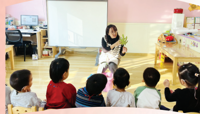
▲康复教师为听障儿童上集体 课程。