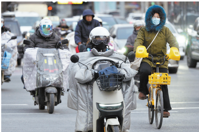
昨日，我市最低气温达-11℃，体感温度最低-13℃。外出市民纷纷增加衣物，抵御寒冷天气。

本报讯(记者 苏晓梅)新的一周以寒冷开头，昨天，我市风寒效应明显。根据最新气象监测信息分析，今明两天，我市气温依然低迷，到 22 日冷空气结束，津城最高气温才会回到零上。