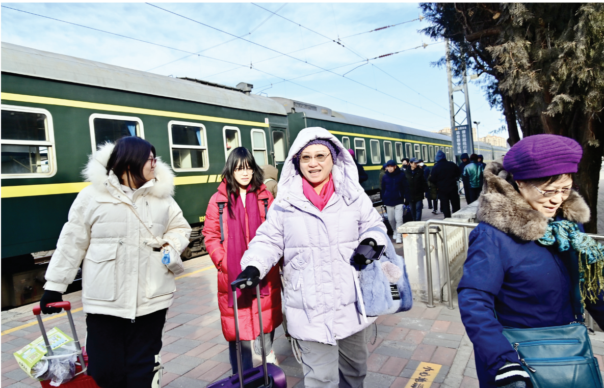
市民一早乘坐津蓟市郊列车去赶集。

芦台大集底蕴深厚，从旧时蓟运河畔漕运码头集市发展为如今横跨十数街道、汇聚上千摊贩、日均接待数万游客的商贸胜地，始终遵循“农历逢三、逢八开集”的古老习俗。马年新春临近，市公交集团将于 1 月 21 日、1 月 26 日、1 月 31 日、2 月 5 日、2 月 10 日、2 月 15 日，开通 6 条定制公交线路，分别由市区天津西站公交站、天津站公交站、文化中心公交站、财经大学地铁站公交站、王顶