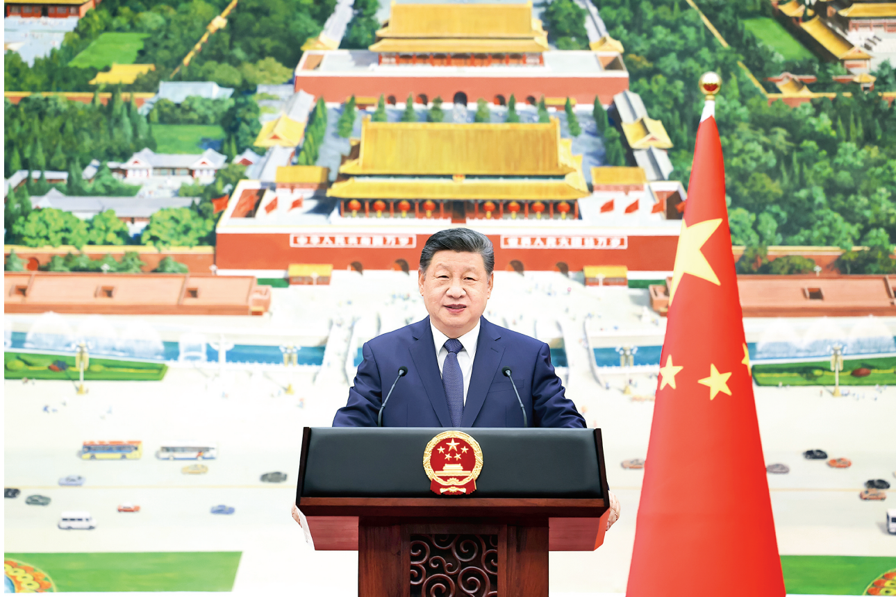
1月16日上午，国家主席习近平在北京人民大会堂接受18位驻华大使递交国书。这是仪式结束后，习近平在北京厅对使节们发表讲话。