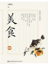
《美食》，王稼句著，九州出版社2025年2月出版。

何谓美食？因社会阶层、宗教信仰、气候地理、食材风俗等不同，人们对美食的理解各有不同。酸甜苦辣，水产陆畜，南北差别很大。即便是同一菜肴，口味也各有不同，北方人口味重，南方人好清淡；北方人以肴饌丰、点食多为美，南方人以肴饌洁、果品鲜为美，清奇浓淡，各有其妙。