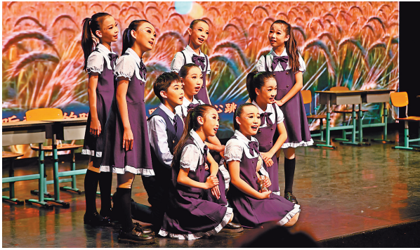
23日至24日,“天津银行·2025天津戏剧节暨第三届天津大学生戏剧节暨首届天津中小校园戏剧节”终评线下展演在光华剧院落幕。

小学组学生以灵动的表演,让《二小放牛郎》《狼牙山五壮士》等经典故事传递红色基因的力量;《哪吒修仙记》的奇幻想象、《非遗剪纸》的匠心传承,展现出传统文化与现代生活的创意融合。中学组的展演更具深度与厚度,《与妻书》《烽火家书》的深情演绎诠释出家国大爱与赤子情怀;《雷雨》的经典再现、《错位时空——走向深蓝》的创