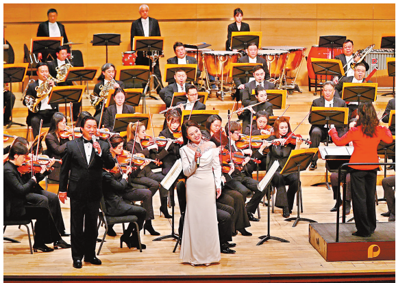
昨晚,天津交响乐团在天津大剧院上演了“农行之约——2026新年音乐会”。

本报讯(记者 王洋)昨晚,天津交响乐团在天津大剧院上演了“农行之约——2026新年音乐会”。